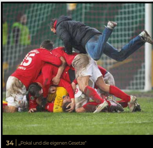
34 | „Pokal und die eigenen Gesetze“