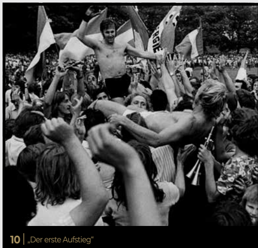
10 | „Der erste Aufstieg“